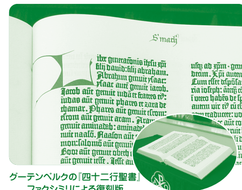
グーテンベルクの「四十二行聖書」 ファクシミリによる復刻版

(宗教センター蔵: 相模原キャンパスウエスレー・チャペルに展示中) 写真は新約聖書マタイによる福音書第1章部分