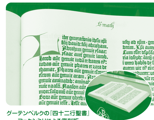
グーテンベルクの「四十二行聖書」 ファクシミリによる復刻版

(宗教センター蔵:相模原キャンパスウエスレー・チャペルに展示中) 写真は新約聖書マタイによる福音書第1章部分