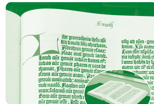
ゲーテンベルクの「四十二行聖書」 ファクシミリによる複製版

(宗教センター蔵: 相模原キャンパスウエスレー・チャペルに展示中) 写真は新約聖書マタイによる福音書第1章部分