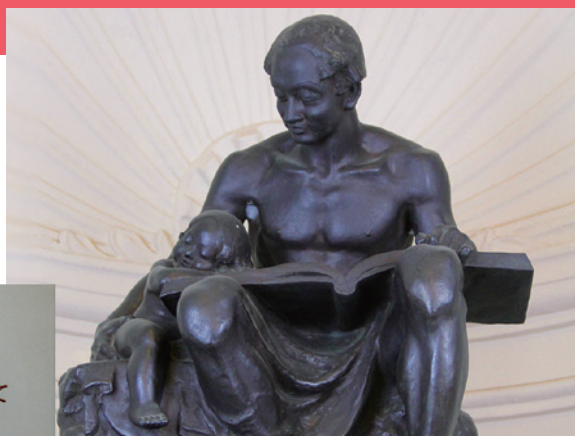
「愛の像」(The Statue of "Love") 制作者：横江 嘉純 寄贈者：万代 順四郎 (間島記念館1階)