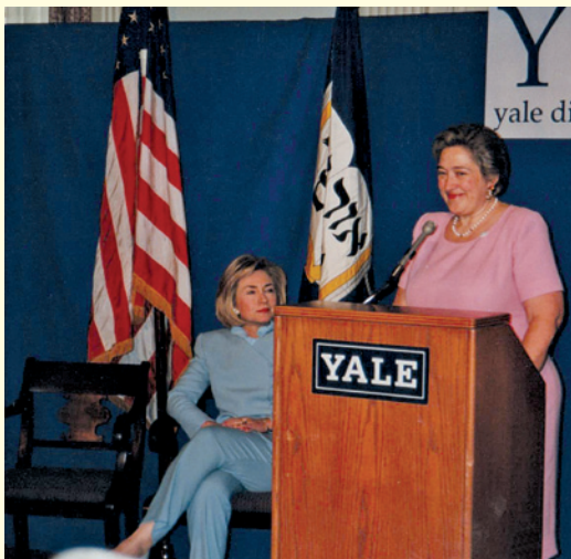
ヒラリー・クリントン氏（左側）執筆者が留学中の1998年、Yale Divinity Schoolに講演にいらした時の写真。ブルーのスーツに身を包んで座っているのがヒラリー氏で、同会者によって講師の紹介がされているところ。執筆者本人が撮影。

の際、民主党の党員から突如ヒラリー・クリントン氏に、十戒に関する質問が投げ掛けられました。ニューヨーク・タイムズ等の報道によると、この質問に対してクリントン氏は、自分がプロテスタントのメソジスト派の信仰を持つ家庭の中で生まれ育ったことに言及し、聖書の中で最も重要な掟は「神を愛し、隣人に仕えることである」と断言しました。そして「隣人に仕える」とは、弱者や異邦人に愛をもって接することでもあり、これこそキリストが私たちに求めておられることであると主張しました。さらに、一部のキリスト者の中には自分自身の罪に目を留めることなく、他者を裁いている者があることに遺憾の意を示しました。このことは、イエス・キリストが「山上の説教」の中で言っておられることでもあります。マタイ7:1-6）クリントン氏は、真の信仰を持つことはその人を謙虚にし、他者に対して敬意と寛容をもって接することを可能にする。自分は決して完全な人間ではない、と断言しました。私はこの告白に、大きな感銘を受けました。自分たちの国のリーダーとなる人が、どのような思想や信仰を持ち、どのような舵取りをしようとする